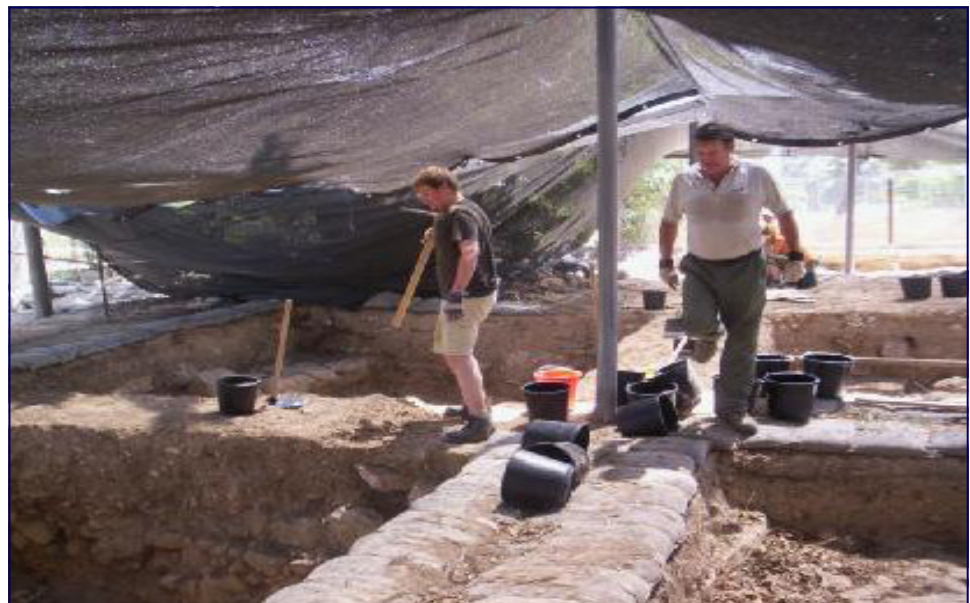
Excavadores trabajando en Ramat Rachel