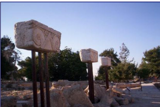
Réplicas de Capiteles Proto-Eólicos hallados por las excavaciones de Aharoni

O.L: Si, estamos llegando a la Edad del Hierro. Queremos excavar el