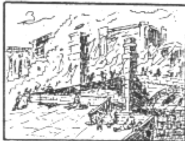
Fin de Numancia (-133). —Escipión rodeó a Numancia con un doble muro, interceptó el río Duero con alambres para privar de viveres a los numantinos y obligarlos a rendirse, pero éstos prefirieron la muerte.