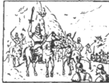
Viriato arenga a sus tropas (año -149). —Cercado Viriato por los romanos que prometieron recompensas a los españoles que quisieran abandonar a su jefe, hablóle éste en tal forma que todos le juraron fidelidad a la que no faltaron jamás.