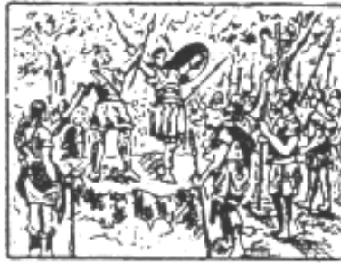
Primer grito de independencia contra los romanos! (-218). — Indibil y Mandonio , jefes de los Ilergetas , excitaron a los españoles a defender su patria contra los romanos; pero las tropas de Escipión acabaron fácilmente con los sublevados.