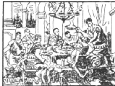
Muerte de Sertorio (-73). —Tramó Perpenna, traidor amigo de Sertorio, una conjuración contra éste. Ofrecióle un banquete y le apuñalaron los conjurados así que uno hizo la señal convenida para matar al noble general.